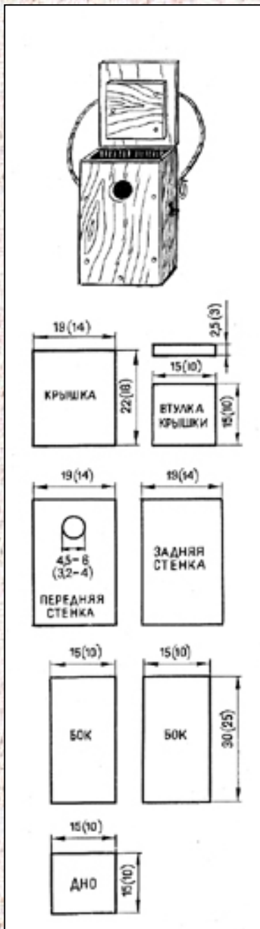
Рис. 2. Дощатое гнездовье-скворечник (синичник).

5. Никаких присадных полочек ни перед летком, ни над летком, ни снаружи, ни внутри приколачивать не надо.